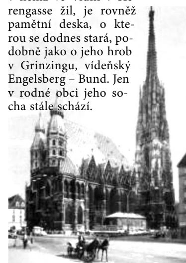
A to je Vídeň – v ní studoval, žil, pracoval a vzpomínal – na rodné Jeseníky, na Andělskou Horu.