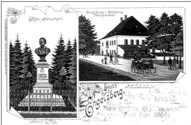
Takto vypadal pomník věnovaný památce skladatele Eduarda Schöna Engelsberga v jeho rodné obci. V této podobě vydržel pouze do roku 1947.